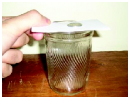
Figura 3. Montagem e procedimento. A figura ilustra a montagem e mostra a mão prestes a puxar o cartão.

• Em [2] (p. 437): Estando em repouso o livro tende, por inércia, a continuar em repouso.