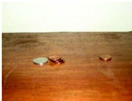
Figura 2. A moeda projétil pára após o choque e a moeda “alvo” recebe “quantidade de movimento”, afastando-se. As demais moedas caem verticalmente.

Neste artigo são discutidos dois experimentos usados para ilustrar a lei da inércia, em livros didáticos do Ensino Médio. Ora, a situação física nesses experimentos é muito mais complicada e sugere a presença de atrito. Assim sendo, a ligação com a lei da inércia não é imediatamente óbvia. Propomos que os tempos envolvidos nas interações entre os materiais são bastante curtos para que haja transmissão da quantidade de movimento pelo atrito.