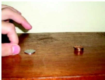
Figura 1. Montagem e procedimento. A mão está prestes a dar um “peteleco” na moeda da esquerda (o “projétil”); à direita, a pilha de moedas.