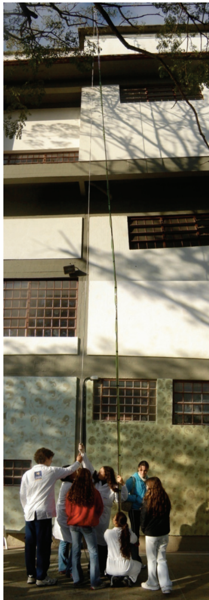
Figura 2 - O Barômetro de água.

O experimento de Gasparo Berti é particularmente interessante e relativamente simples de ser reproduzido em sala de aula, além de permitir a exploração prática de muitos conteúdos associados à mecânica dos fluidos. Construimos, no colégio Monteiro Lobato (Porto Alegre, RS), um barômetro de água (Fig. 2). Como os objetivos de Berti eram diferentes dos buscados em sala de aula, o aparato foi adequado, permitindo que outros tópicos da hidrostática também fossem explorados. Uma estrutura metálica retangular foi fixada no topo do prédio da escola, a uma altura de 14 m. Esta estrutura possui uma roldana que pode-se deslocar horizontalmente por uma distância de 4 m, e ela é responsável